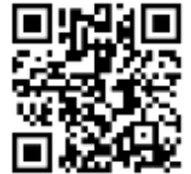
มาตรการรับมือฤดูฝน ปี ๒๕๖๘

สำนักงานเกษตรจังหวัดสระบุรีได้รับแจ้งจากสำนักงานจังหวัด เรื่องมาตรการรับมือฤดูฝน ปี ๒๕๖๘ ว่า คณะกรรมการทรัพยากรน้ำแห่งชาติ ในคราวประชุมครั้งที่ ๒/๒๕๖๘ เมื่อวันที่ ๒๑ กุมภาพันธ์ ๒๕๖๘ มีมติเห็นชอบมาตรการรับมือฤดูฝน ปี ๒๕๖๘ และให้คณะกรรมการทรัพยากรน้ำแห่งชาติ รวมทั้งมอบหมายให้หน่วยงานที่เกี่ยวข้องเร่งรัดการจัดทำแผนปฏิบัติการภายใต้มาตรการดังกล่าว และรายงานผลการดำเนินงานจนกว่าจะสิ้นสุดฤดูฝน เพื่อให้การดำเนินการบรรลุเป้าหมายและสามารถขับเคลื่อนได้อย่างมีประสิทธิภาพ ทันต่อสถานการณ์ที่อาจเกิดขึ้น จึงขอให้อำเภอรับทราบและดำเนินการตามมาตรการรับมือฤดูฝน ปี ๒๕๖๘ ในส่วนที่เกี่ยวข้อง (มาตรการที่ ๑) รายละเอียดตาม QR Code ด้านล่าง