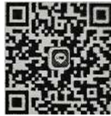
ไลน์กลุ่ม