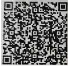
แบบรายงาน

ตามที่สำนักงานเกษตรจังหวัดสระบุรี ได้รับแจ้งจากสำนักงานพัฒนาชุมชนจังหวัดสระบุรี ขอความร่วมมือเจ้าหน้าที่/ข้าราชการในสังกัด ปลูกผักสวนครัว พืชสมุนไพร และไม้ผล อย่างน้อยคนละ ๑๐ – ๓๐ ชนิด ณ บริเวณบ้านพักอาศัย หรือสำนักงาน พร้อมประชาสัมพันธ์ผ่านช่องทางไลน์ กลุ่ม “ปลูกผักสระบุรี” ตามแบบรายงานการน้อมนำแนวพระราชดำริ รายละเอียดปรากฏตามคิวอาร์โค้ดด้านล่างนี้