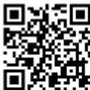
แบบฟอร์มปรับเปลี่ยน MOU GAP ๖๙

- ประเด็นเน้นย้ำ : สามารถปรับเปลี่ยนเป้าหมาย MOU GAP ได้เฉพาะเกษตรกรที่มี พื้นที่ปลูกในอำเภอดียวกันเท่านั้น (เปลี่ยนตำบล)