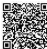
แบบรายงาน ผ.ก.พ.ภูวนาคราช