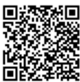
สำเนาคำสั่ง

วันที่ ๒๕ ของทุกเดือนผ่านทางอีเมลของกลุ่มยุทธศาสตร์และสารสนเทศ เพื่อรวบรวมส่งให้สำนักงานเกษตรและสหกรณ์ จังหวัดสระบุรีต่อไป