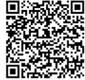
ลงทะเบียนอบรมผู้เข้าร่วม อันตรายนโยบาย