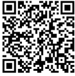
ประชาสัมพันธ์การอบรมและทดสอบความรู้

วิชาการเกษตร ได้แก่ สำนักวิจัยและพัฒนาการเกษตรเขตที่ ๑ - ๘ และศูนย์วิจัยและพัฒนาการเกษตรของกรมวิชาการเกษตร จำนวน ๕๔ แห่ง ทั่วประเทศ แต่ละศูนย์จะเปิดทดสอบความรู้เดือนละ ๒ ครั้ง ในวันแรกของสัปดาห์ที่ ๑ และสัปดาห์ที่ ๓ ของทุกเดือน โดยจะมีการทดสอบความรู้วันละ ๔ รอบ รอบละ ๒๕ คน