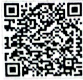
QR Code ๑ คู่มือการคัดเลือก ประจำปี ๒๕๖๖ (pdf)