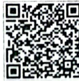
QR Code ๒ คู่มือการคัดเลือก ประจำปี ๒๕๖๖ (word)