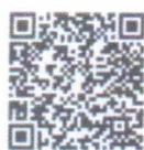
รายวิชา e-Learning ก.พ.