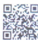
แบบอินชันทัน e-Learning ก.พ.