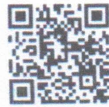
แบบตอบรับ