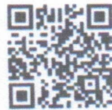
กำหนดการ