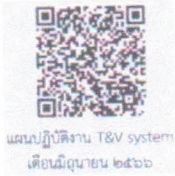
แผนปฏิบัติงาน T&V system เดือนมิถุนายน ๒๕๖๖

สำนักงานเกษตรจังหวัดสระบุรี กำหนดการประชุมเกษตรกรอำเภอประจำเดือน เป็นประจำทุกเดือน โดยการประชุมครั้งที่ ๘/๒๕๖๖ ขอเชิญเข้าร่วมประชุม และจัดทำแผนปฏิบัติงานตามระบบส่งเสริมการเกษตร (T&V System) ประจำเดือนมิถุนายน ๒๕๖๖ ตาม QR Code ที่ปรากฏแนบท้ายนี้ กำหนดแล้วเสร็จภายในวันศุกร์ที่ ๒๖ พฤษภาคม ๒๕๖๖ ก่อนเวลา ๑๒.๐๐ น. เพื่อจะนำเข้าวาระและแจ้งผู้เข้าร่วมประชุมทราบ ต่อไป