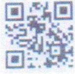
ลิงก์ส่งมาด้วย