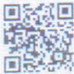
แบบลงทะเบียน

จังหวัดสระบุรี ได้รับแจ้งจากกรมส่งเสริมการเกษตร โดยกองส่งเสริมการอารักขาพืช และจัดการดินปุ๋ย กำหนดจัดอบรมพัฒนาศักยภาพบุคลากรด้านอารักขาพืช หลักสูตร ดิตอาวูททางปัญญา เพื่อพัฒนานักอารักขาพืช ปี ๒๕๖๖ รูปแบบออนไลน์ โดยดำเนินการอบรมระหว่างเดือนพฤษภาคม ถึง เดือนมิถุนายน ๒๕๖๖ วัตถุประสงค์ เพื่อพัฒนาศักยภาพเจ้าหน้าที่ส่งเสริมการเกษตรให้มีความรู้เรื่องการวินิจฉัยอาการผิดปกติของพืช และการจัดการที่ถูกต้องเหมาะสม และมีประสิทธิภาพ เพื่อให้เจ้าหน้าที่ส่งเสริมการเกษตรได้พัฒนาศักยภาพ การปฏิบัติงานด้านอารักขาพืช ขอเชิญเจ้าหน้าที่ผู้รับผิดชอบงานอารักขาพืชระดับอำเภอ และเจ้าหน้าที่ ผู้มีความสนใจพัฒนาตนเอง สมัครเข้ารับการอบรมผ่าน QR Code ด้านล่าง โดยลงทะเบียนภายในวันที่ ๑๐ พฤษภาคม ๒๕๖๖ ทั้งนี้ กรมส่งเสริมการเกษตรจะประกาศรายชื่อผู้สมัครพร้อมเลขประจำตัวการอบรม ทางเว็บไซต์อินเทอร์เน็ตของกรมส่งเสริมการเกษตร (SSNET) ในวันที่ ๑๕ พฤษภาคม ๒๕๖๖