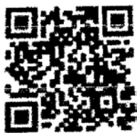
รายงานการประชุม

ตามที่ สำนักงานส่งเสริมและพัฒนาการเกษตรที่ ๑ จังหวัดชัยนาท กำหนดจัดประชุมความร่วมมือการรับรองแหล่งผลิตสินค้าเกษตร GAP พืช ระหว่างกรมส่งเสริมการเกษตรกับกรมวิชาการ (ระดับเขต) ครั้งที่ ๑ /๒๕๖๗ เมื่อวันที่ ๒ เมษายน ๒๕๖๗ ณ ห้องประชุมสำนักงานส่งเสริมและพัฒนาการเกษตรที่ ๑ จังหวัดชัยนาท จึงขอส่งรายงานการประชุมความร่วมมือการรับรองแหล่งผลิตสินค้าเกษตร GAP พืช ระหว่างกรมส่งเสริมการเกษตรกับกรมวิชาการ (ระดับเขต) ครั้งที่ ๑ /๒๕๖๗ รายละเอียดตาม QR Code ที่แนบมาพร้อมนี้ เพื่อให้เจ้าหน้าที่ระดับจังหวัดและอำเภอทราบและถือปฏิบัติต่อไป