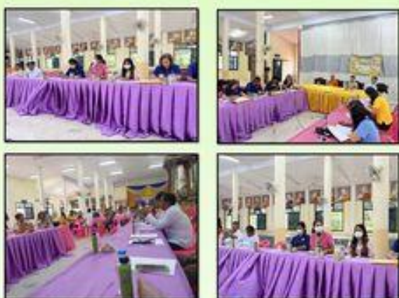
ภาพข่าว สำนักงานเกษตรอำเภอแก่งคอย จังหวัดสระบุรี เผยแพร่ประชาสัมพันธ์ สำนักงานเกษตร อำเภอแก่งคอย จังหวัดสระบุรี โทร. 0-3626-4151