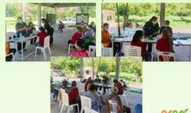
ภาพข่าว สำนักงานเกษตรอำเภอแก่งคอย จังหวัดสระบุรี เผยแพร่ประชาสัมพันธ์ สำนักงานเกษตร อำเภอแก่งคอย จังหวัดสระบุรี โทร. 0-3626-4151