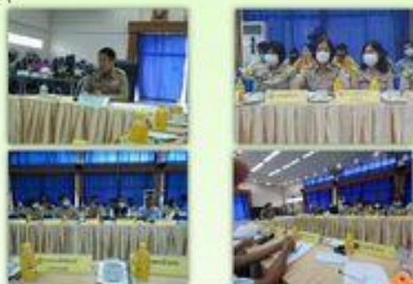
ภาพข่าว สำนักงานเกษตรอำเภอแก่งคอย จังหวัดสระบุรี เผยแพร่ประชาสัมพันธ์ สำนักงานเกษตร อำเภอแก่งคอย จังหวัดสระบุรี โทร. 0-3626-4151