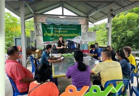
ถนนพระยาพิชัย ตำบลแก่งคอย อำเภอแก่งคอย จังหวัดสระบุรี Tel : 0-3624-4551