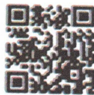
แบบลงทะเบียน

ประธาน มอบคุณสาวตรีเข้าร่วมโครงการฯ ตามกำหนดการต่อไป มติที่ประชุม รับทราบ