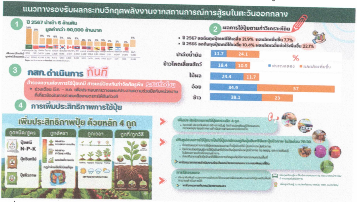
มติที่ประชุม รับทราบ

๓) ประชาสัมพันธ์แนวทางการผลิตและใช้แทนแฉงเพื่อลดปริมาณการใช้ ปุ๋ยเคมีในพื้นที่ เพิ่มจุดเรียนรู้และให้บริการแทนแฉง ณ สำนักงานเกษตรอำเภอ ศูนย์ปฏิบัติการ ศูนย์จัดการดิน ปุ๋ยชุมชน ศูนย์เรียนรู้การเพิ่มประสิทธิภาพการผลิตสินค้าเกษตร (ศพก.) และแปลงใหญ่