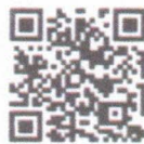
รายละเอียด

สำนักงานเกษตรอำเภอเฉลิมพระเกียรติ จังหวัดสระบุรี ได้รับแจ้งจากสำนักงานเกษตรจังหวัดสระบุรี ตามหนังสือที่ สบ ๐๐๐๘/ว๑๗๙๙ ลงวันที่ ๑๘ มีนาคม ๒๕๖๙ เรื่อง ประชาสัมพันธ์โครงการ depa mini Transformation Voucher ภาครัฐ และรับสมัครนิติบุคคล บุคคลธรรมดาเพื่อขอรับการส่งเสริมและสนับสนุนคู่มือดิจิทัล เพื่อการประยุกต์ใช้เทคโนโลยีและนวัตกรรมดิจิทัล (depa mini Transformation Voucher) สำหรับผู้ประกอบการดิจิทัลที่มีสินค้าหรือบริการดิจิทัลที่ผ่านมาขึ้นทะเบียนบัญชีบริการดิจิทัล : Thailand Digital Catalog ให้สิทธิการใช้งานแก่หน่วยงานภาครัฐ ผ่านมาตรการของสำนักงานส่งเสริมเศรษฐกิจดิจิทัล ประจำปีงบประมาณ พ.ศ. ๒๕๖๘ ครั้งที่ ๒ ซึ่งสามารถสมัครได้ภายในวันที่ ๓๑ มีนาคม ๒๕๖๙ รายละเอียดตาม QR Code