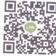
กลุ่มไลน์ : รวมพล YSF Saraburi