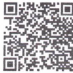
รายละเอียดเป้าหมายการวาดผังแปลง เกษตรกรมติจิทัล