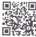
แบบสำรวจ

สำนักงานเกษตรจังหวัดสระบุรี ได้รับแจ้งจากกรมส่งเสริมการเกษตรว่า กรมการค้าภายในได้ประชุมหารือร่วมกับกรมส่งเสริมการเกษตร กรมส่งเสริมสหกรณ์ และภาคเอกชน ได้แก่ สมาคมการค้าปุ๋ยและธุรกิจการเกษตรไทย สมาคมการค้าผู้ผลิตปุ๋ยไทย และสมาคมคนไทยธุรกิจเกษตร โดยได้หารือเกี่ยวกับสถานการณ์ราคาและปริมาณปุ๋ยเคมี และการดำเนินโครงการเชื่อมโยงปุ๋ยเคมีราคาถูกให้แก่เกษตรกร ผ่านสถาบันเกษตรกร ปี ๒๕๖๗ และได้รับการประสานจากสมาคมปุ๋ยฯ ยินดีให้ความร่วมมือ นำปุ๋ยเคมี มาจำหน่ายในราคาถูกผ่านโครงการ ฯ ระยะเวลาตั้งแต่วันที่ ๑ เมษายน ถึงวันที่ ๓๐ มิถุนายน ๒๕๖๗ เพื่อให้การดำเนินโครงการฯ เกิดประโยชน์กับเกษตรกร จึงขอให้อำเภอประชาสัมพันธ์โครงการเชื่อมโยงปุ๋ยเคมีราคาถูกให้แก่เกษตรกร ผ่านสถาบันเกษตรกร ปี ๒๕๖๗ ให้เกษตรกรทราบอย่างทั่วถึง และรวบรวมความต้องการใช้ปุ๋ยจากกลุ่มเกษตรกร และวิสาหกิจชุมชน (ชนิด สูตรปุ๋ย ปริมาณ ยี่ห้อ ชื่อผู้ผลิต) เป็นประจำทุกสัปดาห์ โดยให้สถาบันเกษตรกรและกลุ่มเกษตรกรที่สนใจสั่งซื้อปุ๋ยติดต่อขอข้อมูลเพิ่มเติมได้จากผู้ประสานงานของแต่ละบริษัท และกรอกรายละเอียดการสั่งซื้อในแบบการสั่งซื้อปุ๋ย พร้อมส่งแบบสำรวจความต้องการปุ๋ยเพื่อช่วยเหลือเกษตรกรจากปัญหาราคापุ๋ยเคมีที่ปรับตัวสูงขึ้น ส่งให้สำนักงานเกษตรจังหวัดสระบุรีทราบ ภายในวันจันทร์ทุกสัปดาห์ จนกว่าจะสิ้นสุดระยะเวลาโครงการ เพื่อรายงานข้อมูลให้กรมส่งเสริมการเกษตรทราบเพื่อดำเนินการรวบรวมให้กรมการค้าภายในดำเนินการต่อไป โดยสามารถดาวน์โหลดสิ่งส่งมาด้วย ตาม QR Code ด้านล่าง