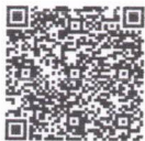
รายละเอียดแปลงปาล์มน้ำมัน

๔.๒.๔ การวาดผังแปลงเกษตรกรมติจิทัล แปลงปาล์มน้ำมัน ปี ๒๕๖๗ และมีแปลงที่ยังไม่ได้ดำเนินการวาดแปลง อำเภอเฉลิมพระเกียรติ ๓ แปลง ให้ดำเนินการวาดแปลงให้แล้วเสร็จภายในเดือนมิถุนายน ๒๕๖๗