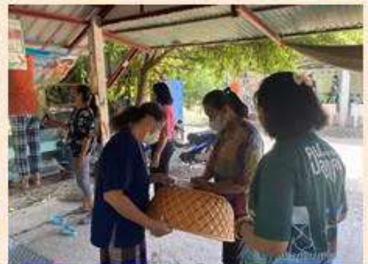
ภาพ/ข่าว สำนักงานเกษตรอำเภอนองแขง จังหวัดสระบุรี