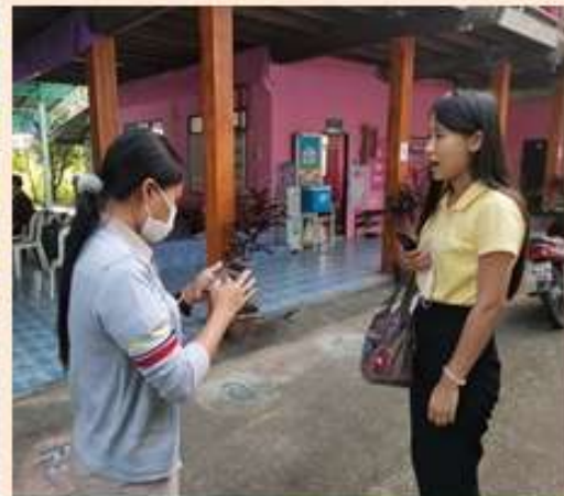
ภาพ/ข่าว สำนักงานเกษตรอำเภอนองแขง จังหวัดสระบุรี