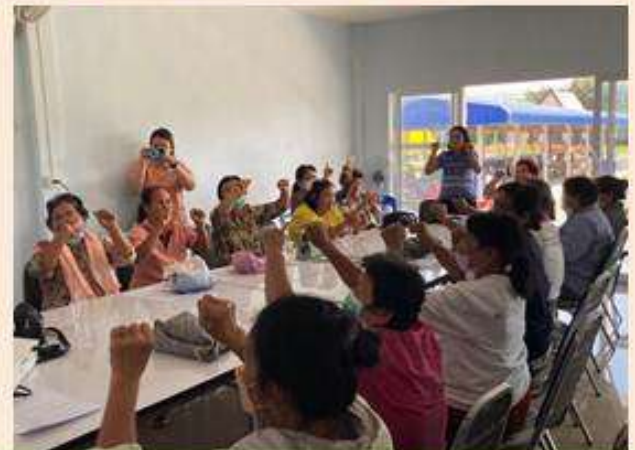
ภาพ/ข่าว สำนักงานเกษตรอำเภอหนองแขง จังหวัดสระบุรี

ที่อยู่ ๒๕ หมู่ ๒ ต.หนองควายโซ อ.หนองแขง จ.สระบุรี Tel./Fax: ๐๓๖๒-๓๖๒๓๑๐