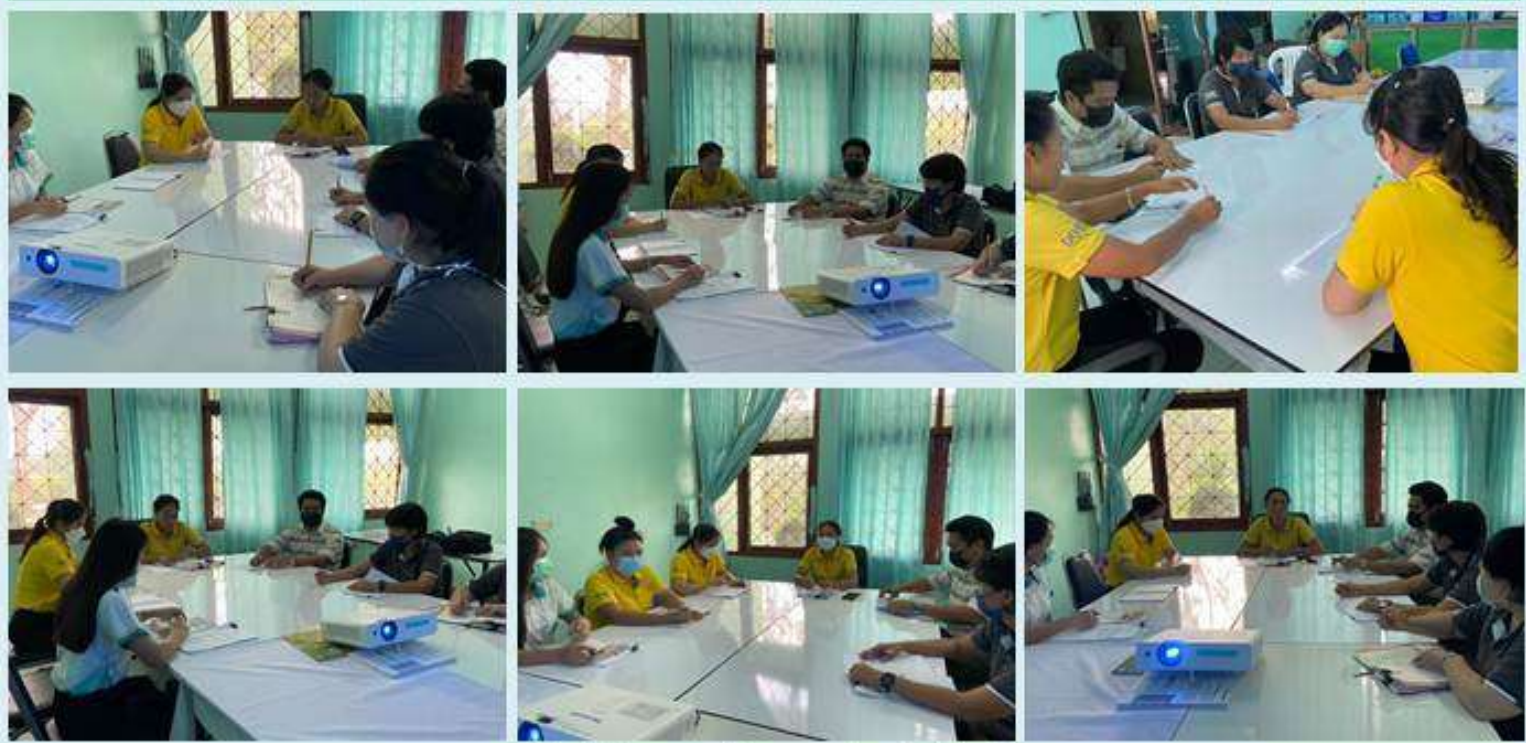
ภาพ/ข่าว สำนักงานเกษตรอำเภอหนองแซง จังหวัดสระบุรี

ที่อยู่ ๒๓ หมู่ ๒ ต.หนองควายไร่ อ.หนองแซง จ.สระบุรี Tel./Fax. ๐๓๖-๓๖๓/๓๑๐